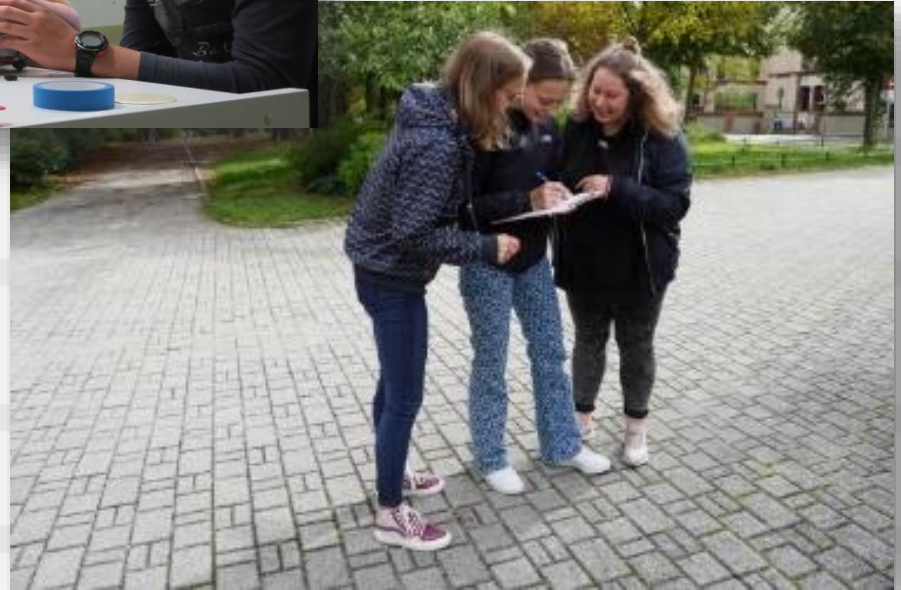
Schülerinnen der FOS Gesundheit und Soziales bei einer Verhaltensbeobachtung