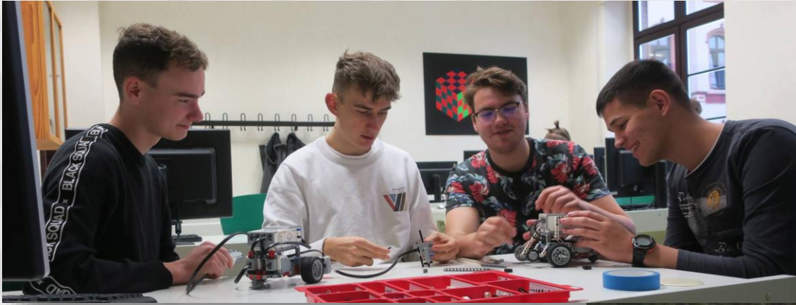
Schüler der FOS Technik bei Experimenten mit einem Roboter