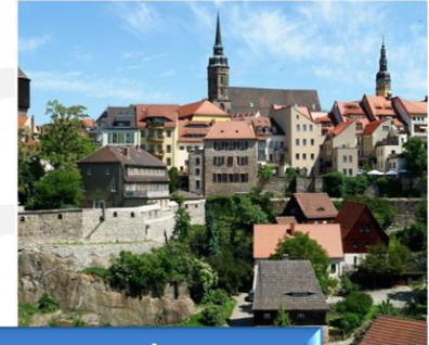
Kurze Wege → Bus, Bahn, Schule und Stadtzentrum