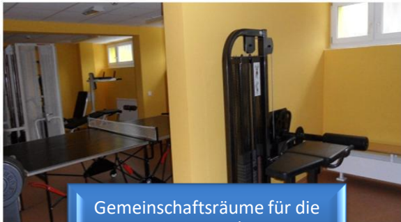
Gemeinschaftsräume für die Freizeitgestaltung