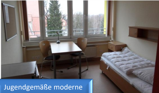
Jugendgemäße moderne Ein- und Zweibettzimmer