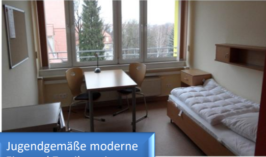
Jugendgemäße moderne Ein- und Zweibettzimmer