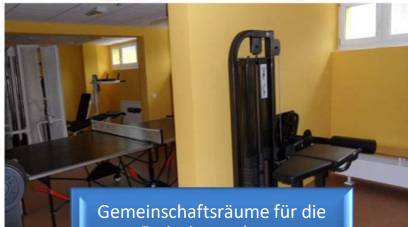
Gemeinschaftsräume für die Freizeitgestaltung