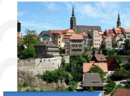
Kurze Wege → Bus, Bahn, Schule und Stadtzentrum